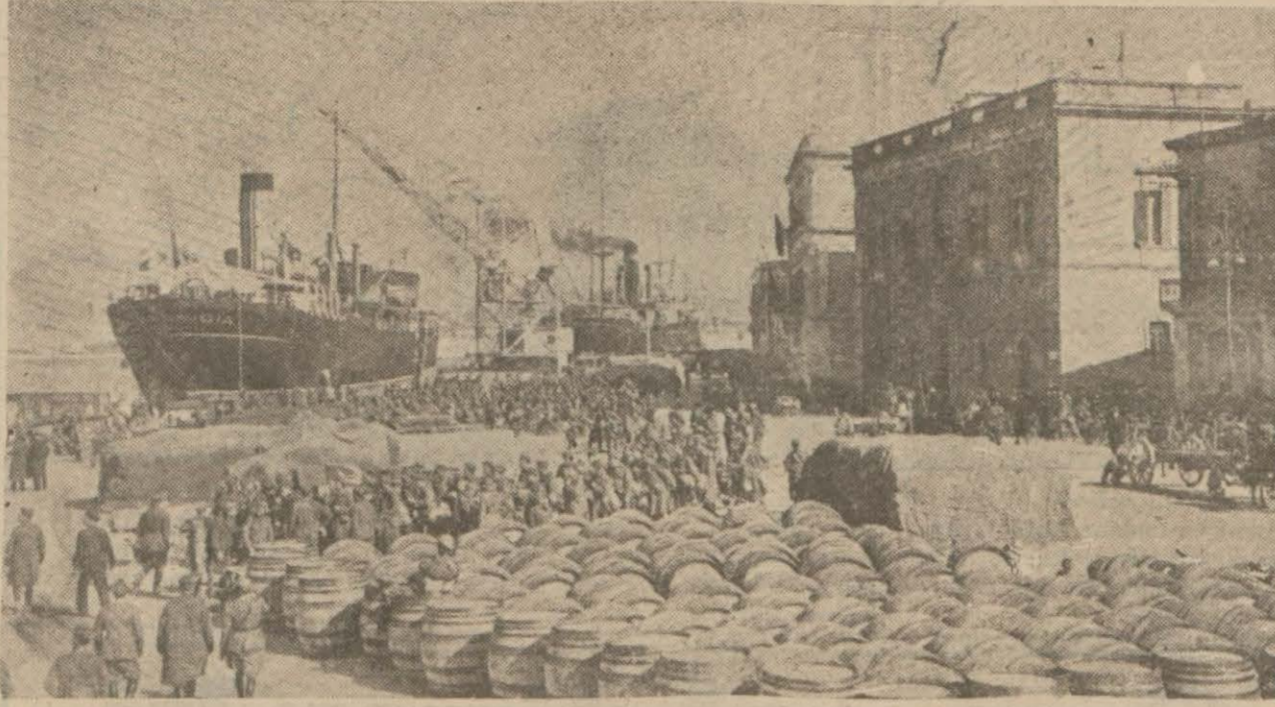
Draç limanından bir görünüş

Dün gece İngiliz ve Sırb tayyareleri Sofyadaki gayri askeri hedeflere yeniden hücum etmişlerdir. İnsanca zayıf azdır. Hasarların tamiri için lüzumlu bütün tedbirler alınmıştır.